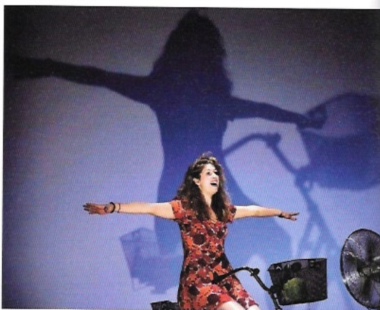
Plus grand que moi, texte et mise en scène Nathalie Fillion (2017)

(1) Plus grand que moi, solo anatomique, du 2 au 28 avril au Théâtre du Rond-Point, à Paris